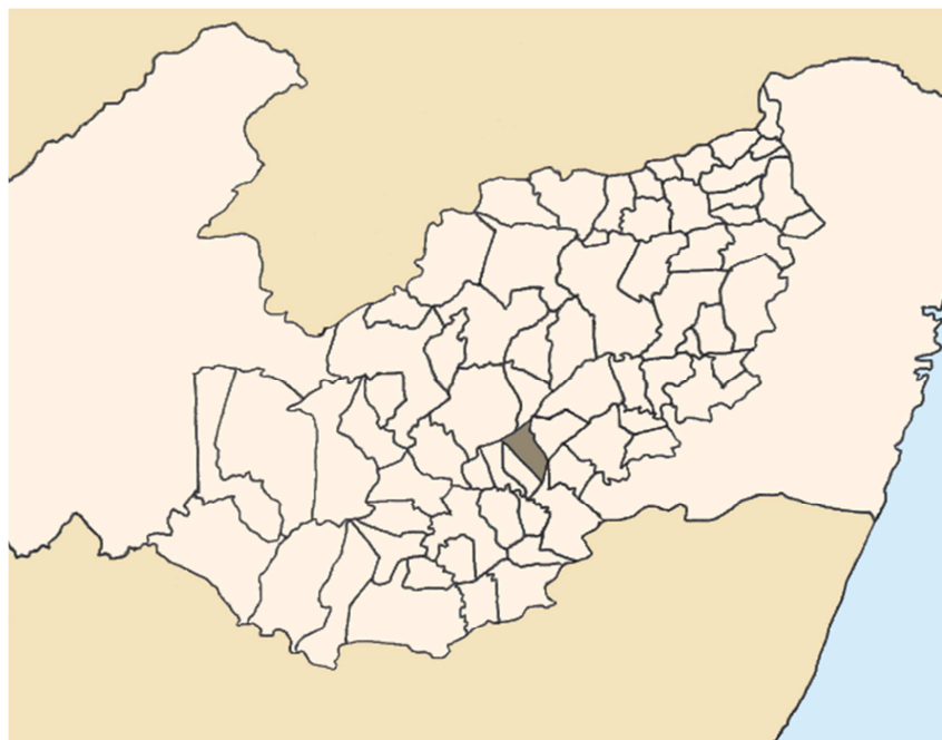
Figura 1 – Município de Lajedo – PE.