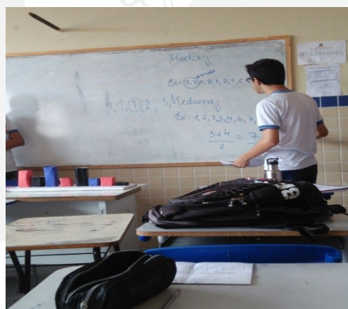
Figura 5 – Grupos realizando a apresentação

A apresentação discutiu inicialmente os conceitos de moda, média e mediana, seguido de alguns exemplos e posteriormente foi explicada as regras do jogo. A seguir foram chamados alguns estudantes para jogar, respondendo as questões no decorrer do mesmo e desta forma construindo novos conhecimentos em estatística.