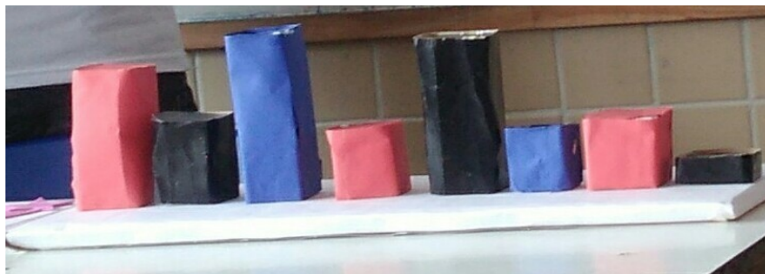
Figura 1 – Gráfico confeccionado com material reciclável

O material utilizado para a confecção do gráfico de barras para apresentação foi caixas de fósforo, o que permite que a área e volume dos dados sejam preservados e não haja alterações de escala. No entanto, quando os alunos cobriram o material a escala e os valores obtidos foram camuflados. Nesse caso, acreditamos ser necessária uma representação no Excel do gráfico para ficarem legíveis algumas informações e ser discutidos aspectos desse gráfico em específico.