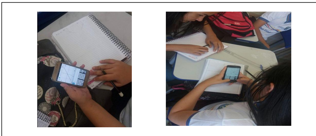
Figura 1- Construção gráfica de Função Afim