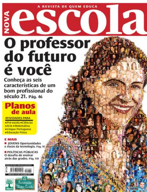
Figura 02: Capa da Revista Nova Escola, ed. 236 out 2010

A segunda capa analisada, objeto deste estudo, faz parte da edição 236, do mês de outubro, de 2010. Retrata o perfil profissional do professor do futuro, evidenciando as principais características de um bom profissional do século XXI.