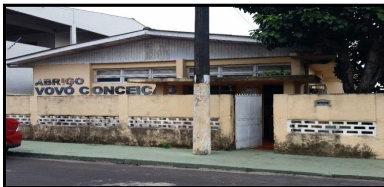
Figura 01: Frente do Abrigo Vovó Conceição

A referida pesquisa de campo, realizada durante a disciplina Criança, Sociedade e Cultura com acadêmicos do 6º período do curso de Licenciatura em Pedagogia do CESP-UEA, foi desenvolvida no Abrigo Municipal Vovó Conceição (FIGURA 01), localizado no município de Parintins-AM. O Abrigo surgiu mediante a necessidade de se ter um local na cidade de Parintins que oferecesse o serviço de acolhimento provisório para crianças e adolescentes vítimas de abandono, abuso sexual, espancamento e qualquer outro tipo de violação de seus direitos.