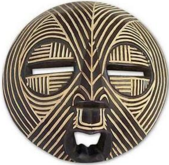
Simetria em estatuas africanas.