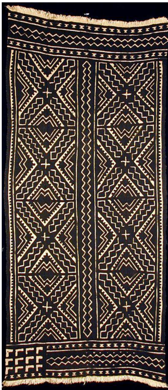
Tecido 1 – da minha sala.

5- Aula 3 – a geometria da arte islâmica.