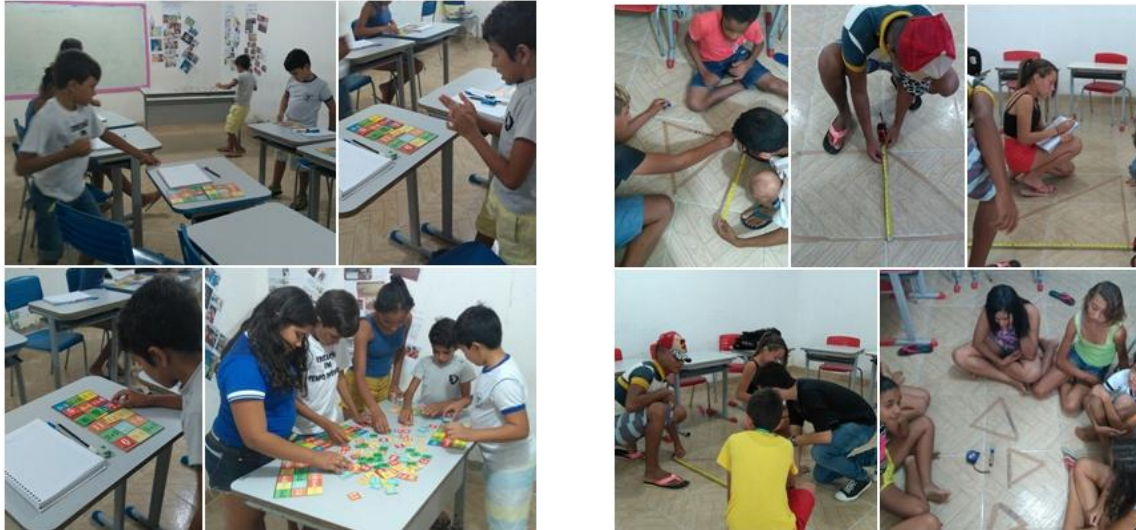
Imagem 3: Desenvolvimento das fases.

A terceira fase, sem duvidas, foi a melhor. O calculo de áreas ainda era um conteúdo difícil para esses alunos e a gamificação veio para mudar isso. A missão era calcular a área de todas as figuras planas que estavam desenhadas no chão da sala. Com a gamificação, teoria e prática andaram juntas de forma a melhorar o ensino e aprendizagem.