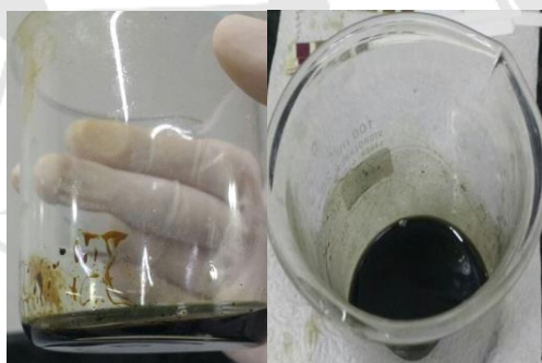
Figura 2. Identificação de Taninos Catéquicos, formação de precipitado (amostra 1); e identificação de taninos Pirogálicos, coloração escura (amostra 2), respectivamente.

No teste de verificação de taninos catéquicos e pirogálicos, foi observado formação de precipitado (amostra 1), e mudança de coloração para uma cor escura (amostra 2), sendo positivo para presença destes compostos.