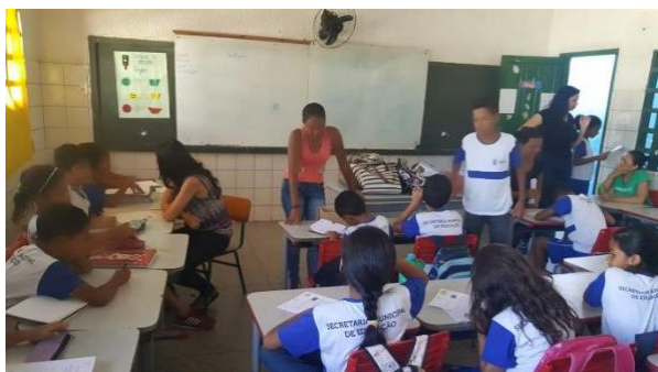
Figura 3 – Prática docente: regência