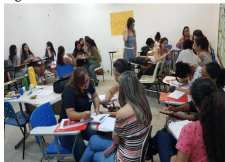
Figura 2- Encontro dos PIBidianos