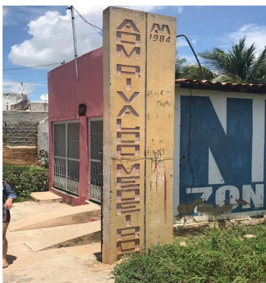
Figura 2: Marco da ponte sobre o riacho que dividia o Pé-rapado e o Berra-bode.