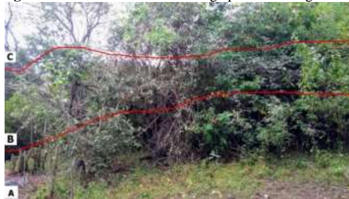
Figura 6 – Fitofisionomias da caatinga presentes no geossítio

Com base nos dados levantados em campo, foram constatados três tipos de fitofisionomias da caatinga, típicas do domínio cristalino. Desse modo, encontra-se no geossítio a predominância da fitofisionomia arbustivas aberta (Figura 6 - A), arbustiva densas (Figura 6 - B) e arbórea (Figura 6 - C), além da vegetação rupícola, característica de afloramentos rochosos.