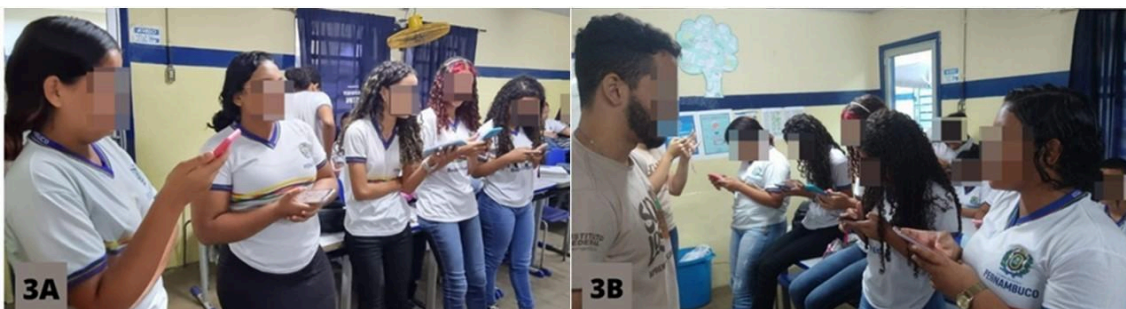
Figura 3: Aplicação do jogo didático Solo do Brasil online na EREM Tristão Ferreira Bessa localizado no município de Lagoa de Itaenga; Figura 3A e 3B: Estudantes da educação básica montando o quebra-cabeça "Solos do Brasil" online durante a realização de uma oficina didático-pedagógica no ensino médio

A aplicação do jogo online foi realizada com a turma dividida em grupos, onde um representante de cada grupo montava o jogo enquanto os demais auxiliavam. O primeiro grupo a completar o jogo deveria elaborar explicações sobre solos, sendo declarado vencedor. O engajamento foi satisfatório, com a participação ativa de todos, mostrando compreensão do conteúdo teórico. Os alunos puderam revisar o tema posteriormente, já que o jogo ficou disponível online ( https://www.jigidi.com/solve/xplcv1om/solos-aprender-e-conservar/ ). O uso de celulares como ferramenta e aprendizagem foi destacado como positivo, auxiliando professores e promovendo a educação em solos.