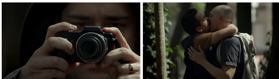
Figura 1 – Vigilância e regulação

Nos primeiros minutos se tem em cena a representação da vigilância que se tem em torno dos indivíduos que fogem à heteronormatividade ( Figura 1 ). É dia, e um homem desconhecido fotografa em um parque um casal de homens que se beijam. Várias fotos são tiradas enquanto o homem expressa um olhar de preocupação. Possibilita-se pensar as formas de vigilância e controle que se mantêm nas sociedades atuais, considerando que ampliaram-se e diversificaram-se as formas de regulação, assim como multiplicaram-se as instâncias e as instituições que se autorizam a ditar normas (LOURO, 2008). Destaca-se que dentre as instituições sociais que atuam de forma significativa para o controle heteronormativo se tem as religiões, por meio de seus discursos e práticas (PINHO, PULCINO, 2016). Essa compreensão é pertinente em conta do que se segue.