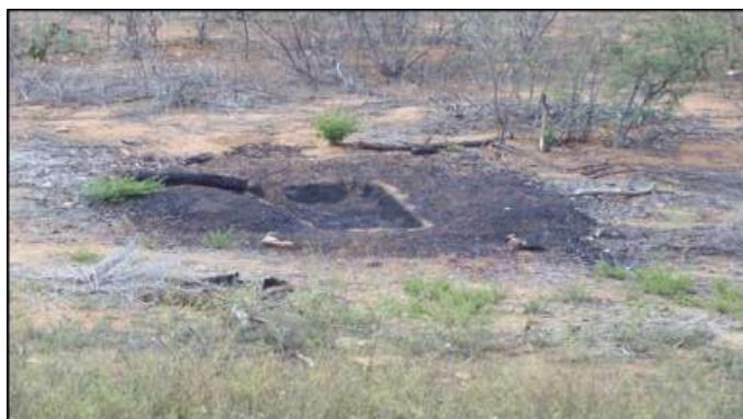
Figura 3 - Imagem representativa da ação antrópica na degradação dos recursos naturais

Na região em estudo foi possível comprovar mais um processo de degradação das terras, a retirada do solo para utilização em cerâmicas regionais. Em geral, os solos da região, são extraídos sem nenhum controle ou fiscalização ambiental (Figura 3).