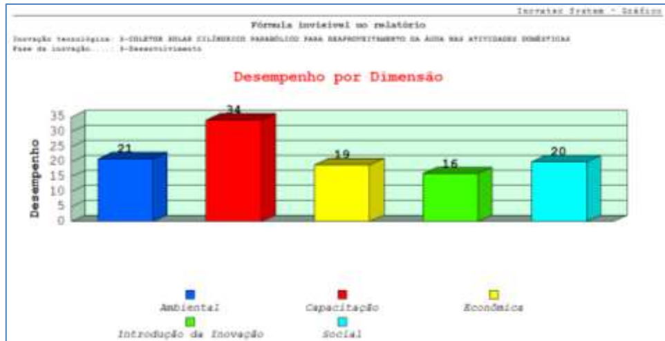
Figura 2. Gráfico do Desempenho por Dimensão do dispositivo em estudo

Os resultados apresentados pelo software mostram a viabilidade da pesquisa proposta, tanto quanto indicadores econômicos, quanto indicadores de sustentabilidade.