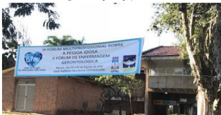
Figura 10: Universidade Federal de Alagoas-local do II Fórum de Enfermagem Gerontológica com a participação do DCEG-AL

O II Fórum de Enfermagem Gerontológica de Alagoas foi realizado em 2018, também em parceria com o Grupo de Pesquisa Multiprofissional sobre Idosos (GPMI) da Escola de Enfermagem e Farmácia (ESENFAR), da Universidade Federal de Alagoas (UFAL), juntamente com III Fórum Multiprofissional do GPMI. Na ocasião uma das enfermeiras, membro do departamento, apresentou uma palestra que tinha como objetivo relatar as experiências exitosas do DCEG-AL. Foi uma contribuição que enriqueceu o evento de modo dialógico e instigante, pois vários alunos se mostraram interessados na especialidade.