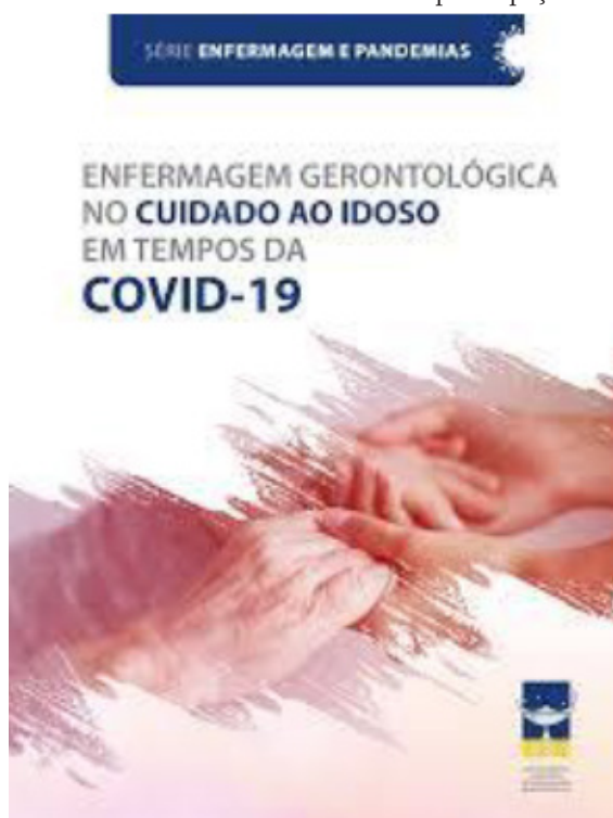
Figura 11: E-book do DCEG Nacional e com a participação do DCEG-AL

O DCEG-AL foi representado na construção do primeiro capítulo do E-book intitulado: “Enfermagem gerontológica no cuidado ao idoso em tempos da COVID-19” – da série enfermagem e pandemias – organizado pelo DCEG Nacional. Essa produção foi um marco importante para a história do departamento, pois contribuiu com uma ampla visão da pessoa idosa no momento da pandemia da COVID-19. Essa obra contou com a produção científica de membros dos DCEGs da maioria dos estados brasileiros, tem sido amplamente divulgada e apresenta-se como uma relevante referência para a enfermagem gerontológica em nível nacional. O DCEG-AL também participa com um capítulo que irá compor o segundo volume da série pandemias.