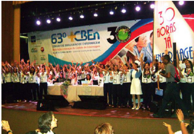
Figura 6: DCEG-AL presente no 63º CBEn em 2017, em Maceió-AL.

O V Congresso Internacional de Envelhecimento Humano (CIEH), em 2017, também aconteceu em Maceió com o tema “Ciência e Representações da Longevidade”. Esse um dos eventos que sempre tem merecido atenção do DCEG-AL, por sua importância social e também pela organização. O departamento contribuiu com o estímulo à participação dos discentes por meio de orientações de trabalhos, a exemplo: “Aplicabilidade das escalas de avaliação do estado de saúde do idoso: relato de experiência” e “A caderneta de saúde da pessoa idosa no contexto da atenção básica”.