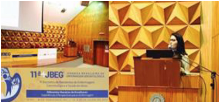
Figura 7: Membro do DCEG-AL na 11ª JBEG em 2017 em Belo Horizonte-MG.

Já na 12ª Jornada Brasileira de Enfermagem Gerontológica em 2019, na cidade de Manaus-AM, com o tema “Enfermagem e os sentidos da Equidade”, a participação foi por meio da apresentação dos trabalhos “Abordagem do envelhecimento no ensino superior” e “Comorbidades na pessoa idosa indicativas da necessidade de cuidados paliativos na atenção básica”. A jornada discutiu três eixos: desafios para a prática de justiça social e de sustentabilidade ambiental; desafios para uma prática equânime e grupos sociais heterogêneos: classes, gênero, geração, raça, etnia e cultura; desafios para a produção equânime e sustentável do cuidado às pessoas, famílias e comunidades em situação de vulnerabilidade.