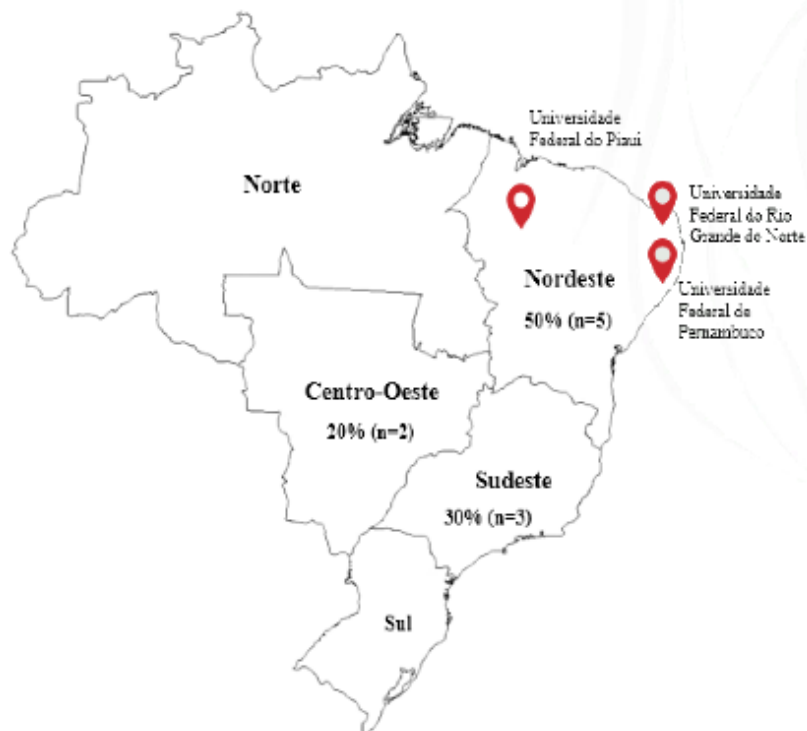
Figura 2 - Distribuição geográfica por região dos Ensaios Clínicos Randomizados acerca da enfermagem Gerontológica no Brasil. Pesqueira, PE. 2022

Referente a localização geográfica de elaboração dos ECR, a maioria eram da região Nordeste, conforme a figura 2, que corrobora com estudo sobre Caracterização dos Ensaios Clínicos Randomizados sobre Urgência e Emergência Realizados por Enfermeiros no Brasil (DE BRITO, et al. 2022), no qual a maioria dos ensaios eram da região Sudeste e Nordeste. Esses dados podem ter relação por se tratar de regiões que possuem centros universitários com grande número de pesquisadores.