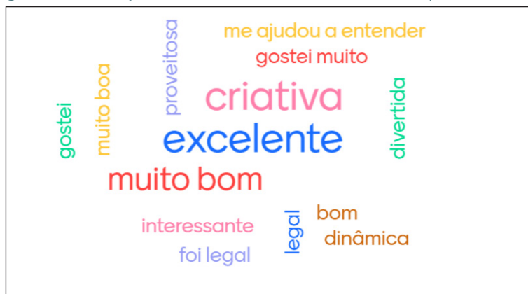
Figura 02 - Avaliação das atividades desenvolvidas na Sequência Didática