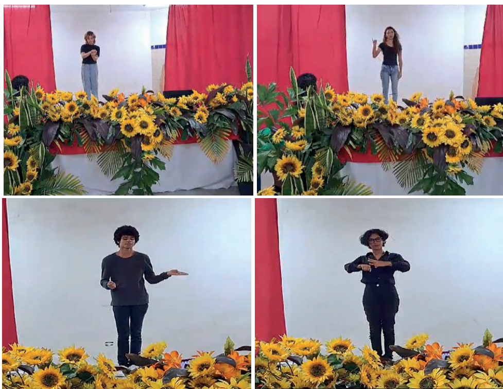
Figura 4. Semana da Pessoa com deficiência

O resultado foi muito satisfatório e eles foram convidados pela coordenação do Atendimento Educacional Especializado – AEE da escola para apresentarem-se durante as atividades da Semana de Inclusão que ocorreu na escola no mês de agosto de 2023 (figura 4). Desta vez, a apresentação foi individual. Por fim, nesta mesma semana, foram requisitados, também, para se apresentarem em outra unidade escolar.