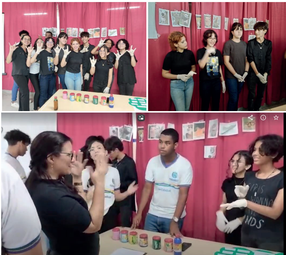
Figura 3. Culminância das eletivas

e ensinaram os sinais de seu tema para os espectadores (demais estudantes da escola, professores e funcionários) que visitaram a sala reservada para exposição da turma de libras e interagiram com eles (figura 3). Desta maneira, eles foram avaliados por suas capacidades em realizar as atividades tanto de forma individual, quanto em grupo, suas habilidades em sinalizar e a expressão facial.