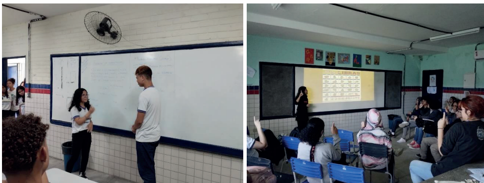
Figura 2. Aulas com práticas.

Da quarta até a sexta aula foi mostrado como sinalizar os dias da semana e meses do ano, cores, termos aleatórios e membros da família. Para esses conteúdos, após a sistematização usual dos assuntos, foi pedido aos discentes que formassem frases simples com os sinais aprendidos até o momento e elaborassem um breve diálogo, aos pares, para treinar o que havia acabado de aprender (figura 2). Assim, garantiu uma melhor assimilação, pois, segundo Valadão et al (2016), a sistemática de apresentar a sinalização em libras e em seguida pedir aos estudantes para repetirem contribui para um melhor aprendizado, uma vez que se capacita na prática.