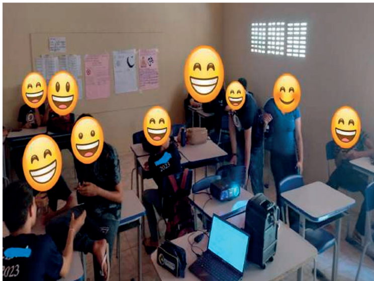
Fig. 4 - Atividade de pesquisa