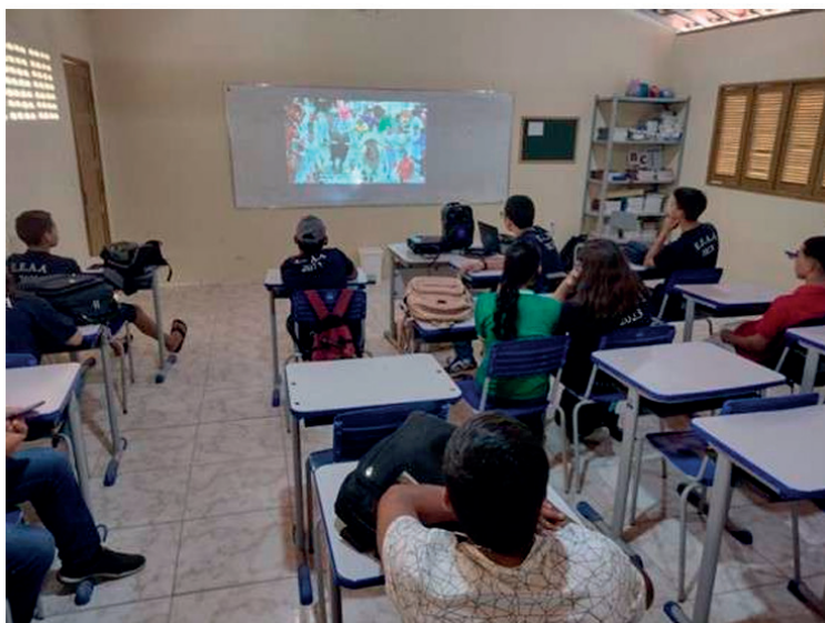
Fig. 1 - Estudantes assistindo ao vídeo Festivals Around the World - World Culture .

Encierro , a La Tomatina e o Festival do Queijo . A atenção dos alunos foi mantida ao longo da exibição, e muitos demonstraram interesse em conhecer mais sobre esses eventos. Alguns alunos, que desconheciam festivais como o de Parintins, ficaram surpresos ao aprender sobre a cultura e a importância desse evento no Brasil. A exibição do vídeo foi um ponto crucial para despertar a curiosidade e motivar discussões espontâneas sobre as tradições culturais.