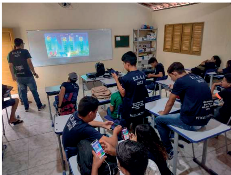
Fig. 2 - Estudantes jogando no Kahoot!

colaboração entre os colegas, fomentou um ambiente de aprendizagem ativa e envolvente. Os alunos se organizaram em duplas e pequenos grupos para participar do jogo, já que alguns não tinham dispositivos móveis. Essa reorganização não planejada inicialmente acabou promovendo uma maior colaboração entre os estudantes, o que reforça a ideia de que o aprendizado colaborativo pode ser incentivado por meio de atividades lúdicas e interativas.