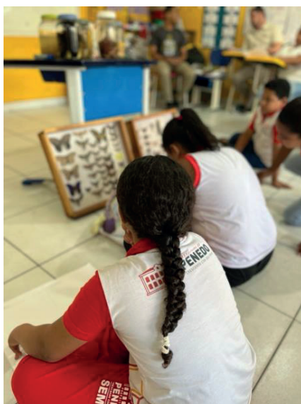
Figura 1 - Interação dos alunos do 4º ano com as caixas entomológicas disponíveis em uma das aulas de Zoologia. Comunidade remanescente quilombola Tabuleiro dos Negros, município de Penedo, Alagoas. 2024.

de papel e pincéis para simular o transporte de pólen, possibilitou que os alunos compreendessem de forma lúdica e sobretudo prática, o processo de polinização, promovendo a internalização do conteúdo com conceitos mais complexos. A compreensão dos conceitos foi também facilitada pela adaptação da linguagem utilizada durante as aulas, ou seja, utilizando termos menos formais para uma melhor compreensão por parte dos estudantes. Ao trazer o conhecimento sobre polinização com o contexto agrícola da comunidade que estão inseridos, possibilitou-se estabelecer uma ponte entre a Ciência e o cotidiano dos estudantes.