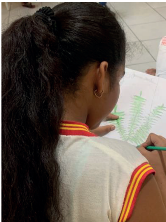
Figura 4: aluna participando da última atividade desenvolvida na ação (desenho das plantas e animais do cotidiano dos alunos, na comunidade). Comunidade remanescente quilombola Tabuleiro dos Negros, município de Penedo, Alagoas. 2024.