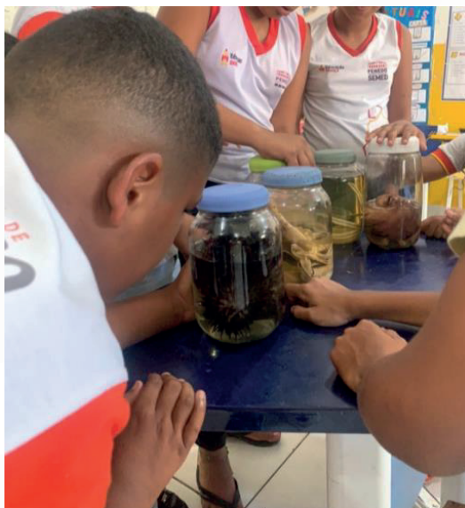
Figura 3 - Alunos observando material didático de Zoologia (polvo, lula, ouriço, água viva, estrela do mar). Comunidade remanescente quilombola Tabuleiro dos Negros, município de Penedo, Alagoas. 2024

Fonte: dados da pesquisa de campo. 2024.