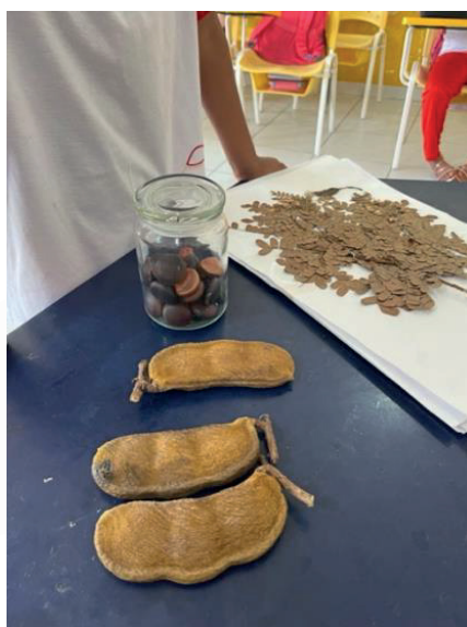
Figura 2 - Aluno observando os frutos e as sementes de olho de boi ( Dioclea violacea ), planta nativa da região. Comunidade remanescente quilombola Tabuleiro dos Negros, município de Penedo, Alagoas. 2024.