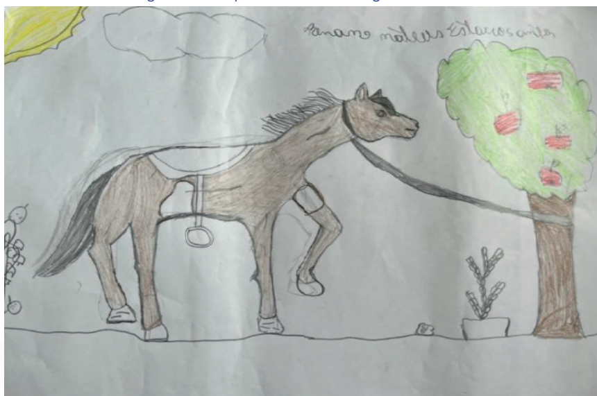
Figura 5: Desenho representativo de um cavalo, macieira e tomateiro, elementos do cotidiano e imaginário (macieira) dos alunos (resultado da última atividade realizada). Comunidade remanescente quilombola Tabuleiro dos Negros, município de Penedo, Alagoas. 2024.