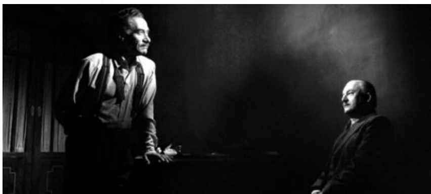
Figura 2 – Luz e sombra

Eu fiz um truque que é bom, que é assim: luz muito forte nos atores, à volta nada [...] Escurece-se tudo que está à volta e ilumina os atores, que é o que interessa, a cara dos atores e o que eles dizem. O resto é a emoção que as pessoas veem. (BOTELHO, 2020 – informação verbal)