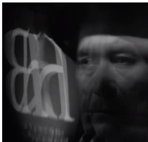
Figura 5 - Efeito de transparência aplicado em um Ricardo Reis que prefere desvanecer a enfrentar suas questões

O mesmo raciocínio se dá com Ricardo Reis, quando ele se apercebe sem ganas de se posicionar diante das demandas que lhe aparecem: um filho, fruto de uma relação fortuita com uma empregada, prestes a nascer, a impossibilidade de corresponder aos anseios de uma jovem apaixonada, de família abastada, mas que ambiciona um amor tradicional, a efervescência política que lhe requer tomada de partido, e o fato de se sentir um estrangeiro em sua própria terra natal. Ao se dar conta dessas questões, o protagonista começa a refletir sobre a chance de acompanhar seu amigo, em uma viagem definitiva, e, com isso, passa a ficar, como ele e paulatinamente, cada vez mais transparente.