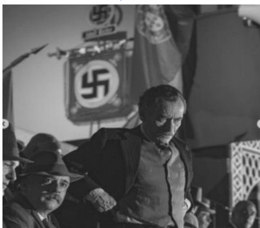
Figura 4 - A suástica, no plano de fundo, em destaque