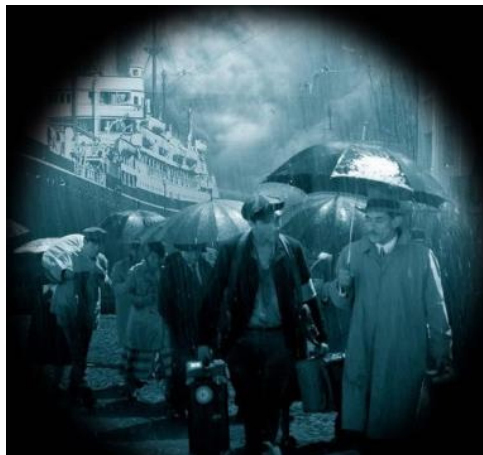
Figura 1 - Ricardo Reis retorna a Lisboa no Hiland Brigade

protagonista com o fantasmagórico Fernando Pessoa, parece simbolizar aqueles tempos sombrios em que as palavras e as ações, por vezes, tornavam-se escorregadias e arriscadas.