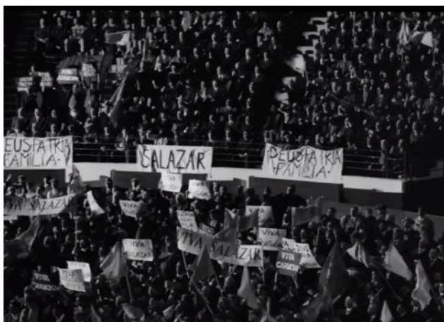
Figura 3 - Faixas em defesa do regime totalitário em destaque

exaltado, que brada frases de apoio e devoção. Aliás, o ditador surge constantemente, no filme, seja com suas medidas publicadas nas notícias de jornal lidas quase diariamente por Reis, seja na foto estampada na parede da sala do oficial do Governo que notifica Reis para prestar-lhe esclarecimentos acerca do seu retorno a Lisboa. Em todas as ocasiões, o jogo de luz guia imediatamente os olhos do espectador para esses signos que remetem ao cenário político português da época retratada na narrativa.