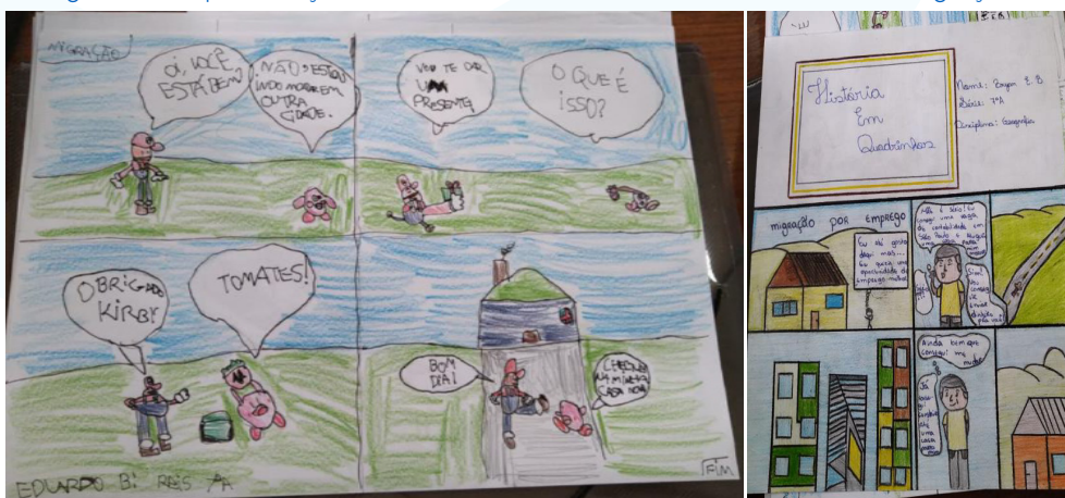
Figura 01: Representação dos estudantes em HQs sobre o conceito de migrações.

Um fato interessante a ser destacado, é a maneira com que os estudantes relacionavam estes conceitos com os influenciadores que acompanhavam na internet, os estudantes listaram nomes que foram de outros estados para São Paulo, e até mesmo, nomes que foram para os Estados Unidos produzir conteúdo para as redes sociais. Com os conceitos apropriados, foi proposto aos estudantes, que fizessem representações do conceito de migração através de uma história em quadrinhos (Figuras 01, 02, 03 e 04).