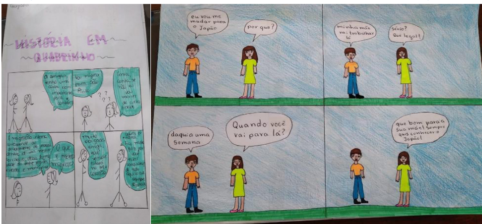
Figura 03: Representação dos estudantes em HQs sobre o conceito de migrações

A proposta realizada no sétimo ano com HQs pode proporcionar o estímulo de criação de representação dos próprios estudantes, a partir de um tema que seja problematizador e que gere debates, instigando o pensamento crítico dos estudantes em determinados assuntos e conteúdos geográficos. Este tipo de construção além de incitar a reflexão de temáticas complexas da Geografia também pode ser desafiante e imaginativo, ao passo que os estudantes procuram sair de sua zona de conforto em sala de aula para representar o espaço geográfico por meio de histórias em quadrinhos.