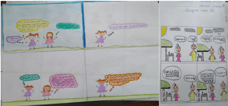
Figura 02: Representação dos estudantes em HQs sobre o conceito de migrações